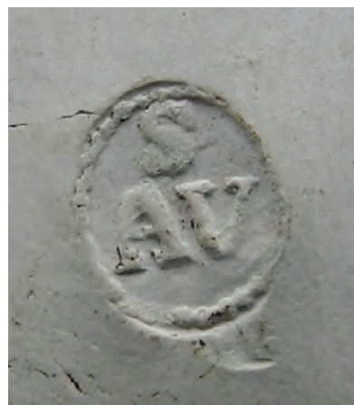
Afb. 1b. Merk van de pijp in afbeelding 1a